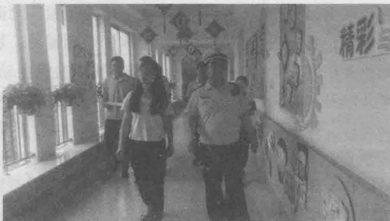
沔东新城行政审批局与多个职能部门对民办非营利幼儿园的 许可事项进行联合踏勘

求，对营商环境的优化起到了重要的推动作用，获得了良好的反馈。在陕西省推进职能转变协调小组办公室简报 2018 年第 20 期，套餐式审批优化办事流程模式被刊登推广。