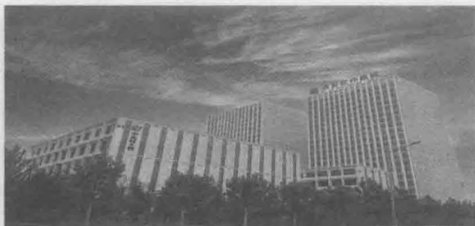
中关村e谷（西安）核芯空间位于高新区软件新城